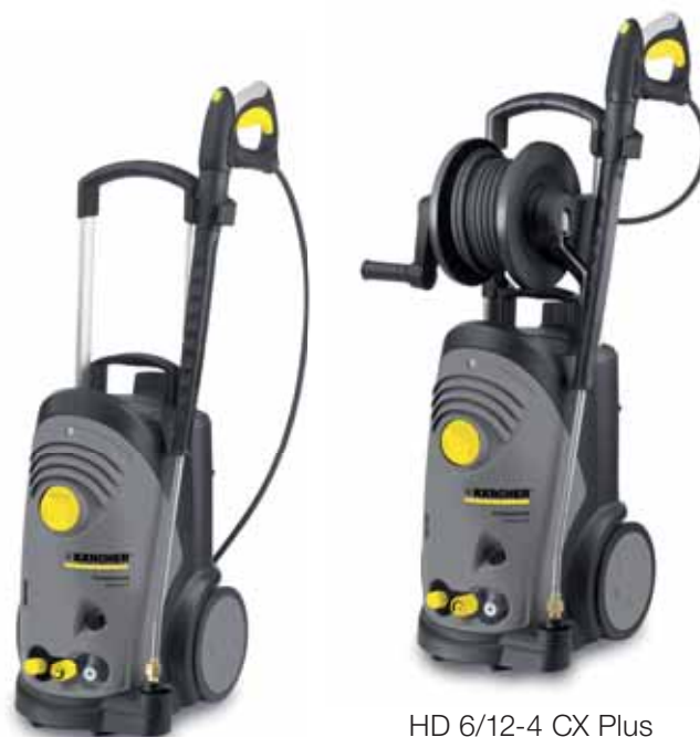
HD 6/12-4 CX Plus